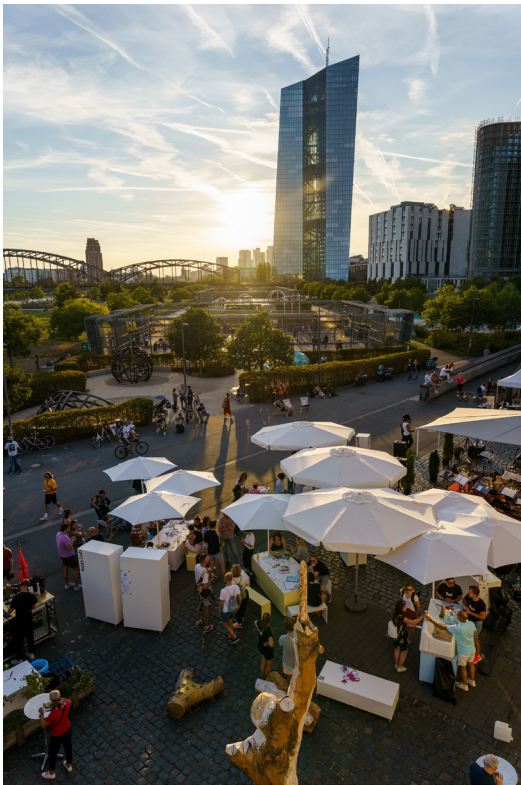
Abbildung 2 Impression kep.lab © Stadt Frankfurt am Main (Foto: Esra Klein)

Mit diesem Ansatz wurde ein neues und wirksames Format der Bürger*innenbeteiligung in einen KEP-Prozess integriert. Insgesamt konnten auf diese Weise weit über 500 Bürger*innen aktiv eingebunden werden. Auffällig war, dass sich auch zahlreiche Jugendliche beteiligten und teilweise sogar ihre Freund*innen einluden, ebenfalls mitzuwirken.