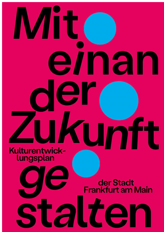
Abbildung 5 Cover des KEP-Abschlussberichtes.

durch den konsequenten Einsatz des eigens entwickelten Corporate Designs. Neben spezifischen Formatvorlagen umfasst dies unter anderem nachhaltig produzierte Stifte, Notizblöcke, Plakate, Aufsteller, T-Shirts und Moderationskärtchen.