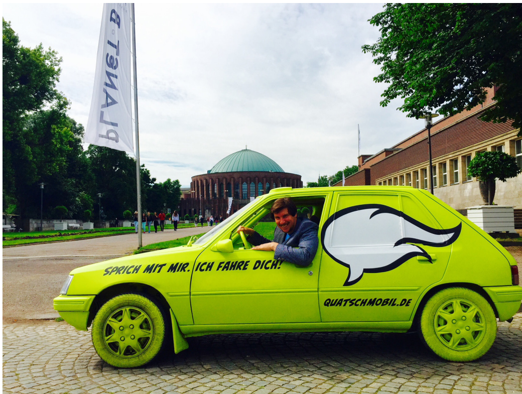
Abbildung 4 Quatschmobil im Einsatz, © Dinah Bielicky, Kulturamt Landeshauptstadt Düsseldorf

Der Bericht zum „kep.lab“ kann unter www.kep-ffm.de heruntergeladen werden.