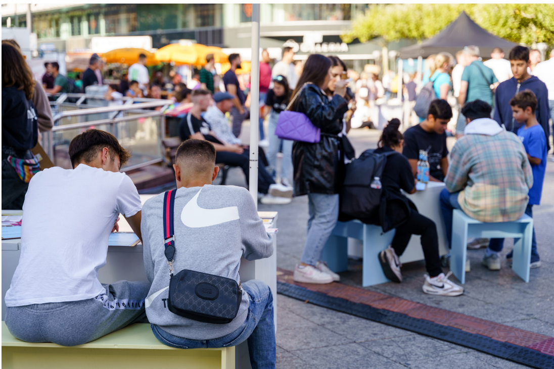
Abbildung 3 Impression kep.lab © Stadt Frankfurt am Main (Foto: Esra Klein)

Mit diesem Ansatz wurde ein neues und wirksames Format der Bürger*innenbeteiligung in einen KEP-Prozess integriert. Insgesamt konnten auf diese Weise weit über 500 Bürger*innen aktiv eingebunden werden. Auffällig war, dass sich auch zahlreiche Jugendliche beteiligten und teilweise sogar ihre Freund*innen einluden, ebenfalls mitzuwirken.